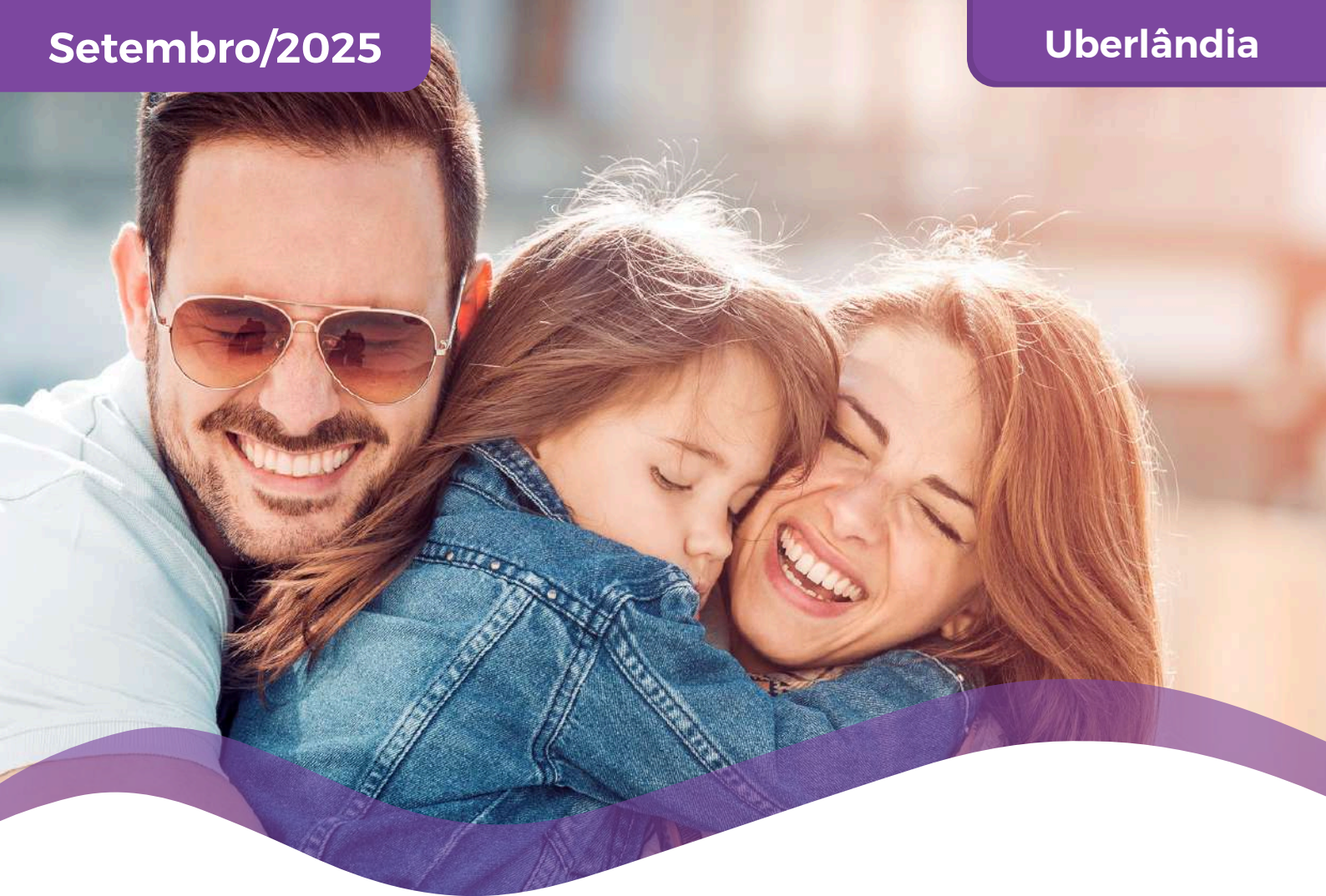
TABELA DE PREÇOS COLETIVO POR ADESÃO