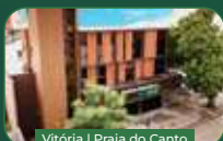
Vitória | Praia do Canto