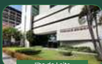
Ilha do Leite