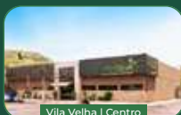
Vila Velha | Centro