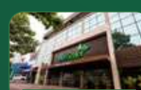
Belo Horizonte | Gutierrez