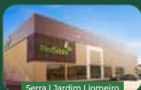
Serra | Jardim Liemeiro