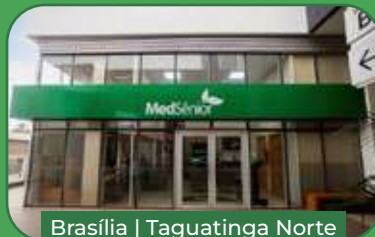
Brasília | Taguatinga Norte