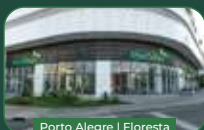
Porto Alegre | Floresta