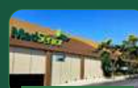
Belo Horizonte | Pampulha