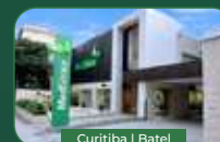
Curitiba | Batel