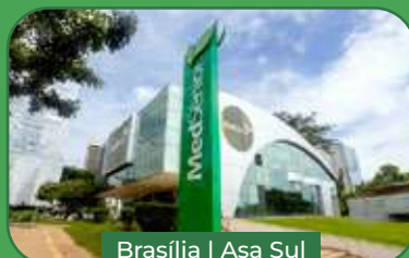
Brasília | Asa Sul