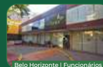
Belo Horizonte | Funcionários