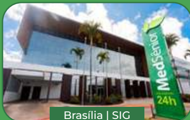
Brasília | SIC