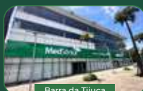
Barra da Tijuca