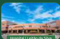
Hospital | Leitão da Silva