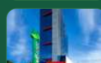
Contagem | Eldorado