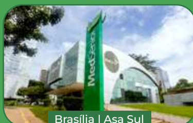
Brasília | Asa Sul