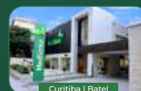
Curitiba | Batel