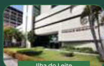
Ilha do Leite