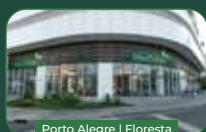
Porto Alegre | Floresta