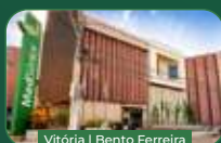
Vitória | Bento Ferreira