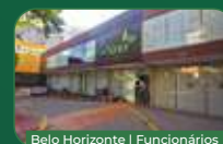
Belo Horizonte | Funcionários