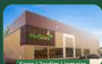
Serra | Jardim Liameiro