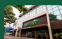
Belo Horizonte | Gutierrez