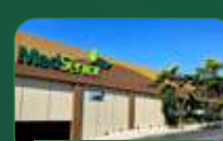
Belo Horizonte | Pampulha