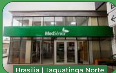
Brasília | Taguatinga Norte