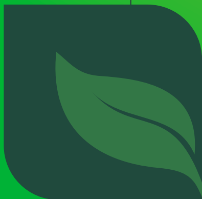
TABELA PME 2 A 29 VIDAS