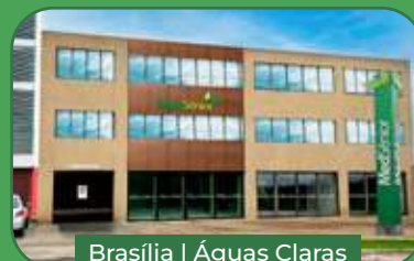
Brasília | Águas Claras