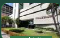
Ilha do Leite