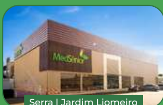
Serra | Jardim Liomeiro