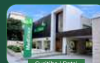
Curitiba | Batel