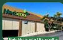
Belo Horizonte | Pampulha