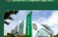
Brasília | Asa Sul