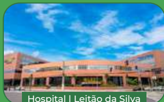
Hospital | Leitão da Silva