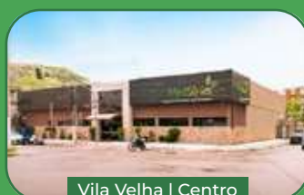
Vila Velha | Centro