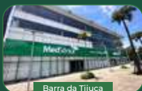
Barra da Tijuca