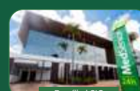
Brasília | SIG