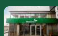
Brasília | Taguatinga Norte