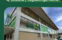
Brasília | Taguatinga Sul