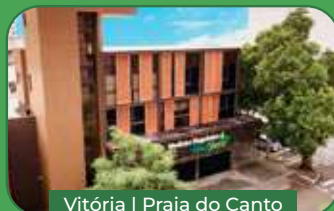
Vitória | Praia do Canto