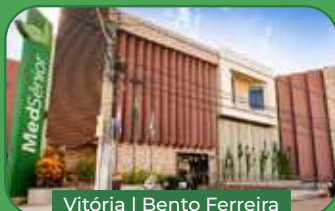
Vitória | Bento Ferreira