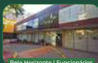
Belo Horizonte | Funcionários