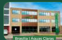
Brasília | Águas Claras