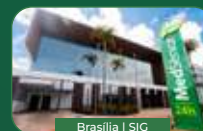
Brasília | SIG