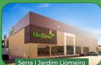
Serra | Jardim Liomeiro