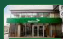
Brasília | Taguatinga Norte