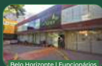
Belo Horizonte | Funcionários