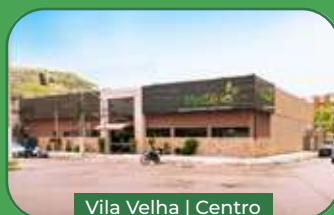
Vila Velha | Centro