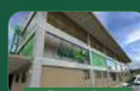
Brasília | Taguatinga Sul