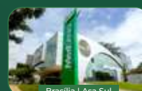
Brasília | Asa Sul