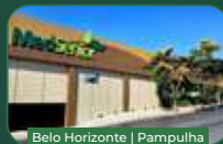
Belo Horizonte | Pampulha