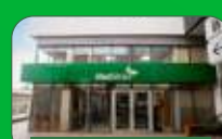
Brasília | Taguatinga Norte