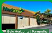
Belo Horizonte | Pampulha