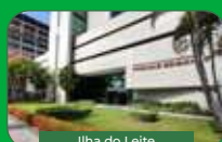
Ilha do Leite