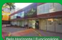
Belo Horizonte | Funcionários