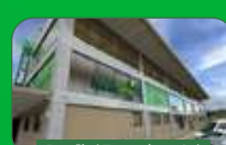
Brasília | Taguatinga Sul