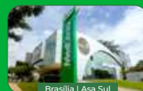
Brasília | Asa Sul