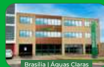
Brasília | Águas Claras