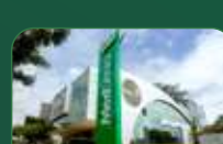
Brasília | Asa Sul