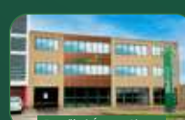
Brasília | Águas Claras