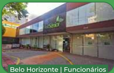
Belo Horizonte | Funcionários