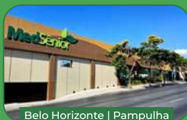
Belo Horizonte | Pampulha