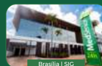
Brasília | SIG