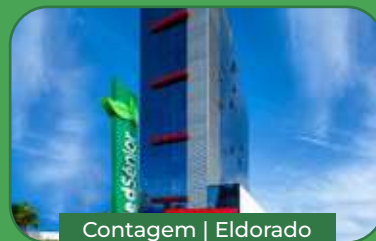
Contagem | Eldorado