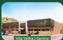
Vila Velha | Centro