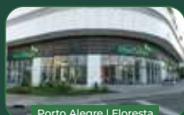
Porto Alegre | Floresta