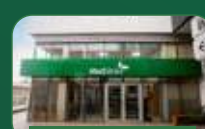
Brasília | Taguatinga Norte