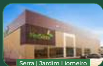
Serra | Jardim Liomeiro