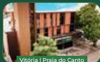
Vitória | Praia do Canto