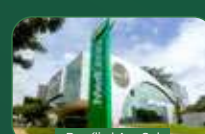
Brasília | Asa Sul