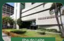
Ilha do Leite