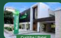
Curitiba | Batel