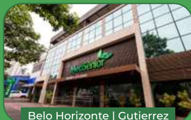
Belo Horizonte | Gutierrez