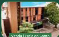
Vitória | Praia do Canto