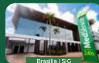
Brasília | SIG