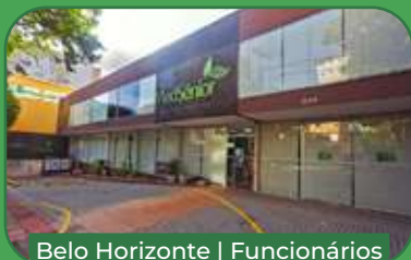
Belo Horizonte | Funcionários