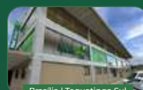
Brasília | Taguatinga Sul