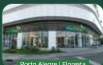
Porto Alegre | Floresta