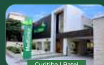
Curitiba | Batel