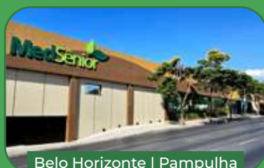
Belo Horizonte | Pampulha