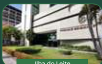
Ilha do Leite