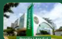
Brasília | Asa Sul