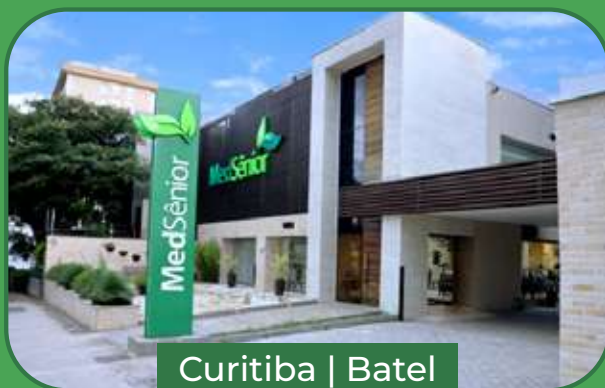
Curitiba | Batel