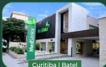
Curitiba | Batel