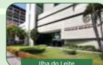
Ilha do Leite