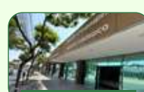
Belo Horizonte | Pampulha