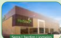
Serra | Jardim Liomeiro