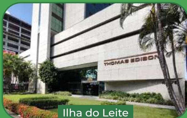
Ilha do Leite