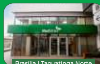
Brasília | Taguatinga Norte