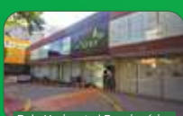
Belo Horizonte | Funcionários