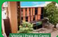
Vitória | Praia do Canto