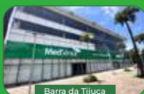
Barra da Tijuca