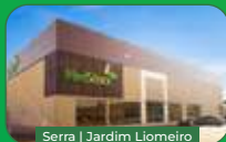
Serra | Jardim Lameiro