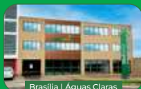
Brasília | Águas Claras