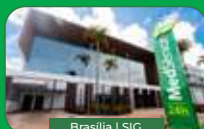
Brasília | SIG