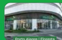
Porto Alegre | Floresta