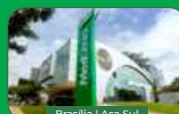
Brasília | Asa Sul