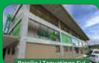
Brasília | Taguatinga Sul