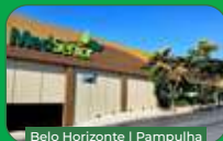
Belo Horizonte | Pampulha