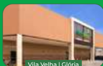
Vila Velha | Glória