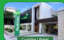
Curitiba | Batel