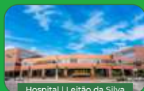
Hospital | Leitão da Silva