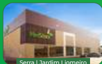
Serra | Jardim Liomeiro