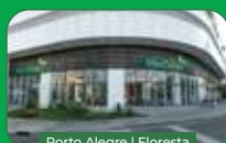
Porto Alegre | Floresta