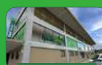
Brasília | Taguatinga Sul