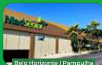
Belo Horizonte | Pampulha