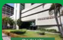
Ilha do Leite