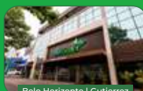
Belo Horizonte | Gutierrez