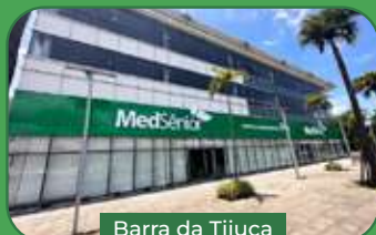
Barra da Tijuca