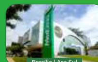
Brasília | Asa Sul