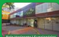
Belo Horizonte | Funcionários