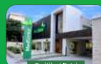
Curitiba | Batel