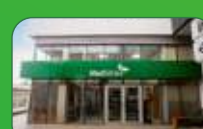
Brasília | Taguatinga Norte