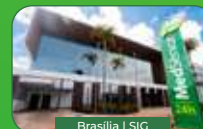
Brasília | SIG