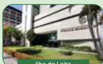
Ilha do Leite