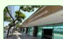
Belo Horizonte | Pampulha