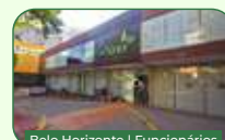
Belo Horizonte | Funcionários