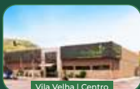
Vila Velha | Centro