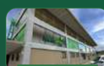
Brasília | Taguatinga Sul