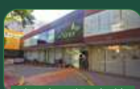
Belo Horizonte | Funcionários