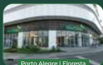
Porto Alegre | Floresta