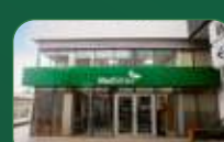
Brasília | Taguatinga Norte