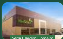
Serra | Jardim Liameiro