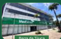
Barra da Tijuca