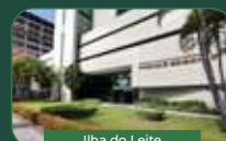
Ilha do Leite