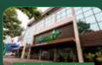
Belo Horizonte | Gutierrez