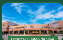
Hospital | Leitão da Silva