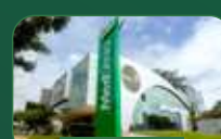
Brasília | Asa Sul