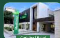
Curitiba | Batel