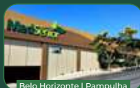
Belo Horizonte | Pampulha