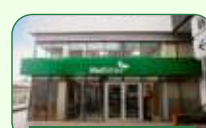
Brasília | Taguatinga Norte