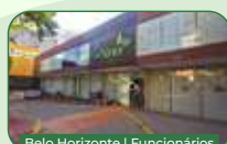
Belo Horizonte | Funcionários