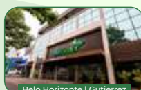
Belo Horizonte | Gutierrez