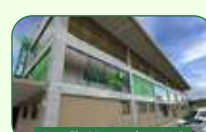
Brasília | Taguatinga Sul