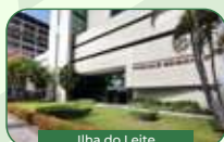
Ilha do Leite