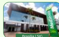
Brasília | SIG