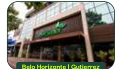
Belo Horizonte | Gutierrez