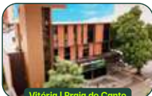
Vitória | Praia do Canto