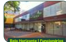
Belo Horizonte | Funcionários