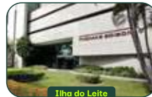
Ilha do Leite