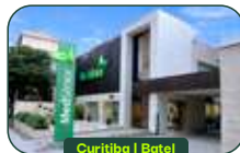
Curitiba | Batel