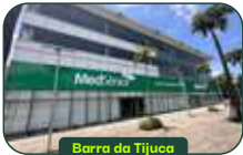
Barra da Tijuca