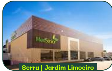
Serra | Jardim Limoeiro