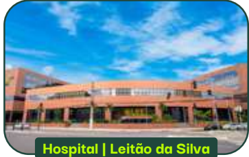
Hospital | Leitão da Silva