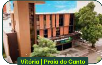
Vitória | Praia do Canto