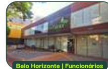
Belo Horizonte | Funcionários