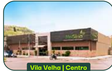
Vila Velha | Centro