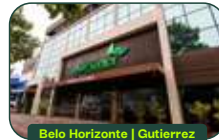
Belo Horizonte | Gutierrez