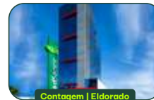
Contagem | Eldorado