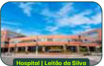
Hospital | Leitão da Silva