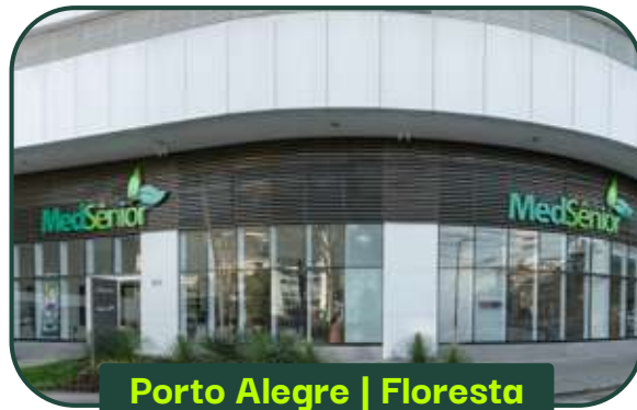
Porto Alegre | Floresta