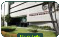
Ilha do Leite