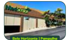
Belo Horizonte | Pampulha