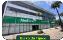
Barra da Tijuca