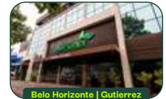
Belo Horizonte | Gutierrez