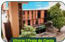
Vitória | Praia do Canto