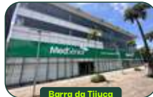
Barra da Tijuca