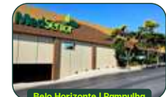
Belo Horizonte | Pampulha