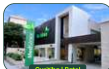
Curitiba | Batel