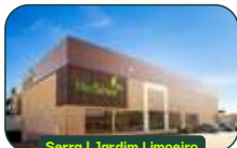
Serra | Jardim Limoeiro