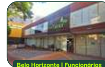
Belo Horizonte | Funcionários