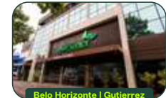
Belo Horizonte | Gutierrez