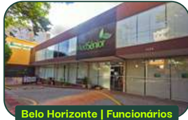
Belo Horizonte | Funcionários