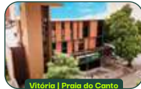
Vitória | Praia do Cento