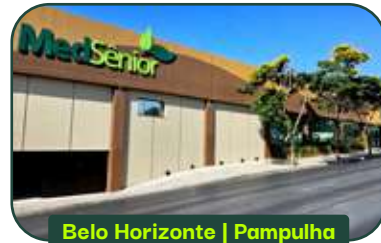
Belo Horizonte | Pampulha