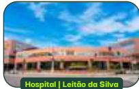
Hospital | Leitão da Silva