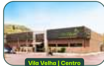
Vila Velha | Centro