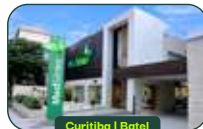
Curitiba | Batel