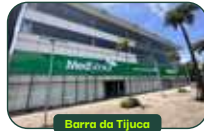
Barra da Tijuca