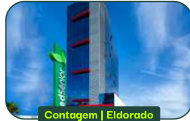
Contagem | Eldorado