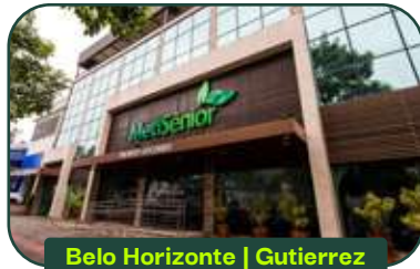
Belo Horizonte | Gutierrez