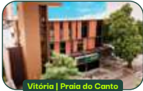
Vitória | Praia do Canto