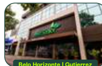
Belo Horizonte | Gutierrez