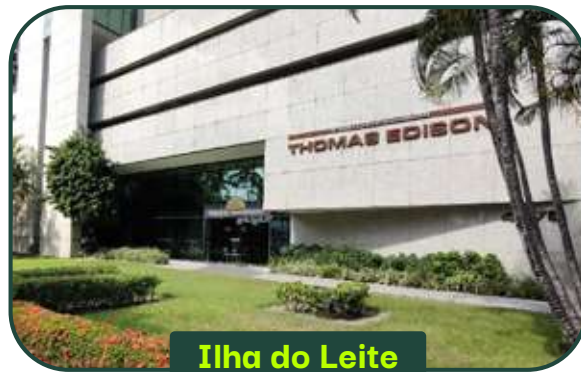
Ilha do Leite