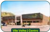
Vila Velha | Centro