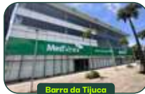
Barra da Tijuca