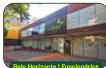
Belo Horizonte | Funcionários