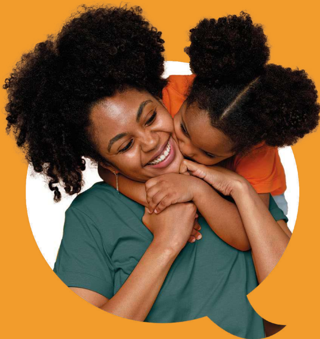
Tabela de Preços

INDIVIDUAL / FAMILIAR EMPRESARIAL ATÉ 29 VIDAS