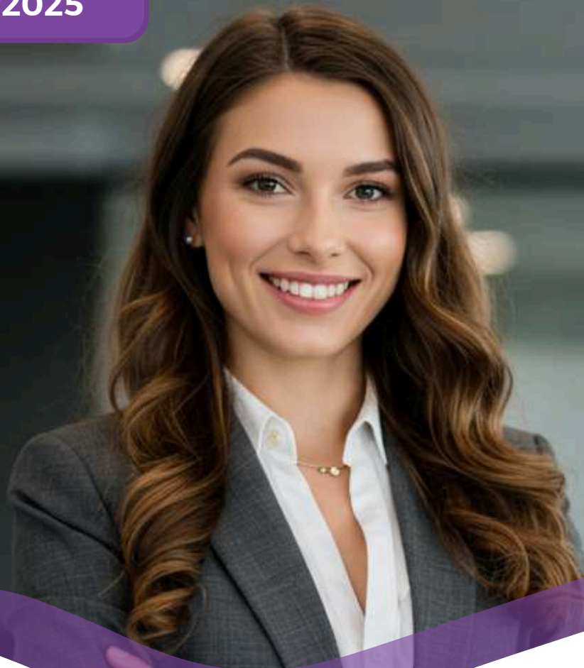
TABELA DE PREÇOS COLETIVO POR ADEÇÃO