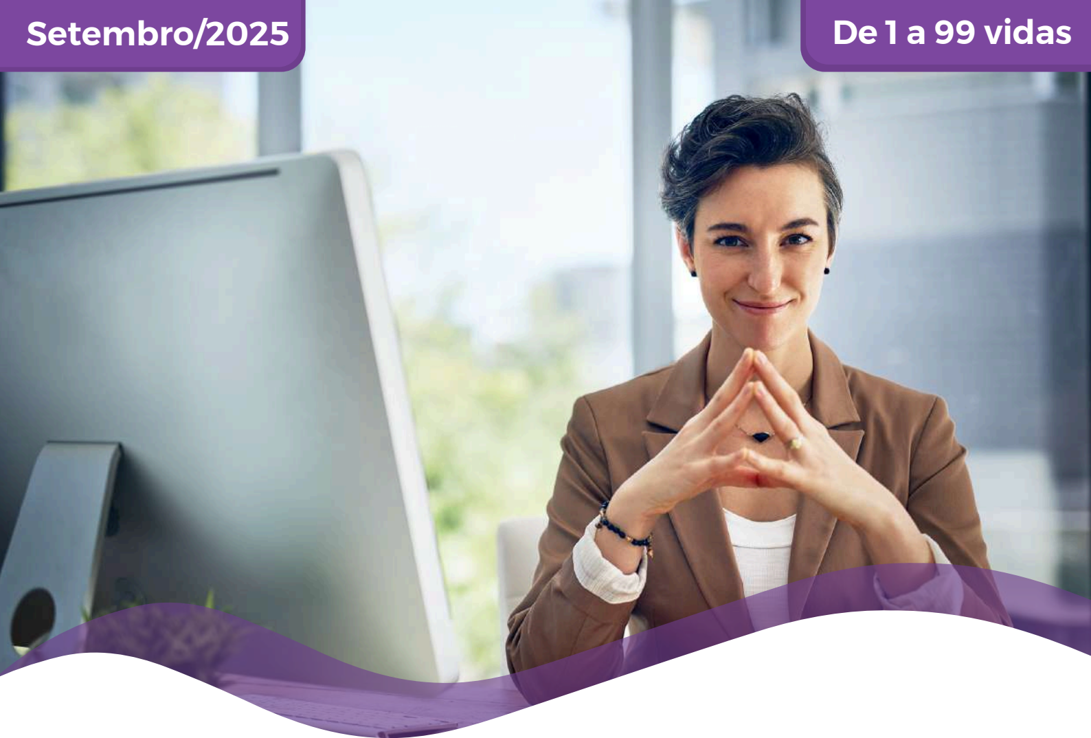
TABELA DE PREÇOS EMPRESARIAL