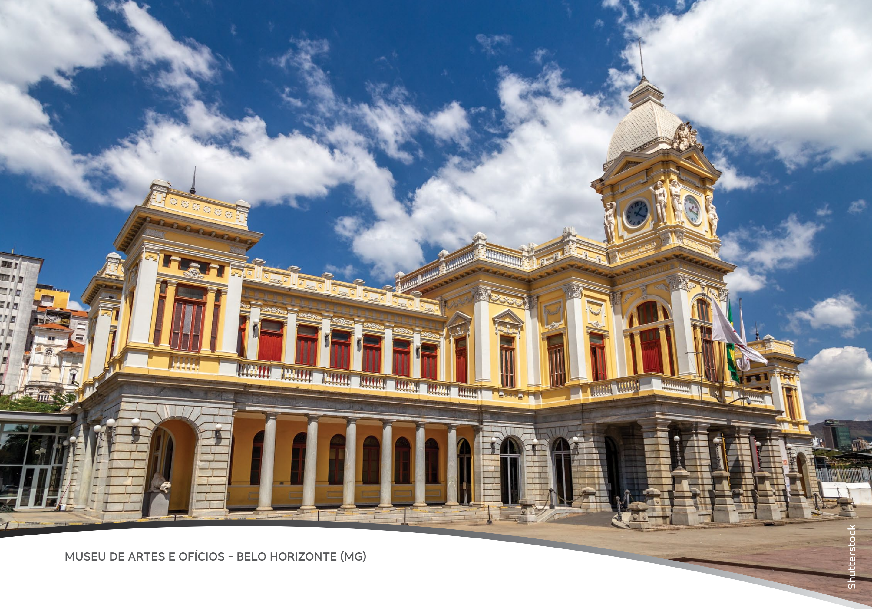
MUSEU DE ARTES E OFÍCIOS - BELO HORIZONTE (MG)

Estado de múltiplas riquezas, Minas Gerais é um polo industrial, agropecuário e cultural. Reconhecido por seus atrativos naturais e com um patrimônio histórico rico e diverso. O povo mineiro é hospitaleiro e sua cultura é marcada por tradições religiosas, pela culinária típica e por uma crescente produção artística e cultural.