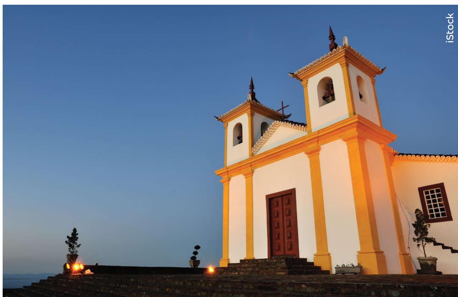
SANTUÁRIO NOSSA SENHORA DA PIEDADE- CAETÉ - BELO HORIZONTE (MG)

A rede hospitalar mencionada é uma referência da Bradesco Saúde e pode ser alterada a qualquer tempo, seguindo-se as normas da ANS. Para consultar a rede referenciada atualizada, inclusive em outras localidades, acesse www.bradescosaude.com.br ou baixe, gratuitamente, o aplicativo Bradesco Saúde nas lojas iOS e Android. Referência: outubro/2022.