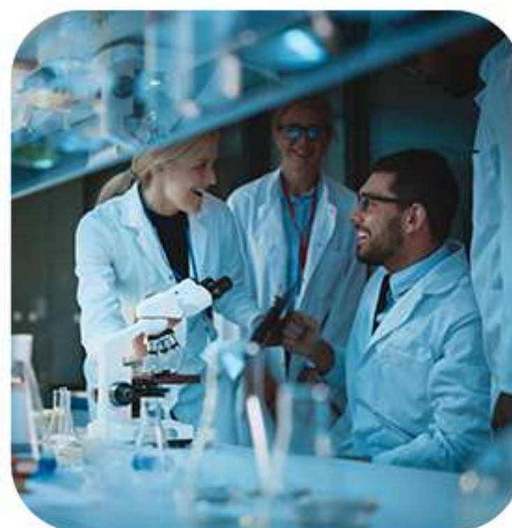
AMPLA REDE CREDENCIADA