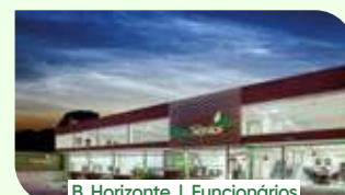
B. Horizonte | Funcionários