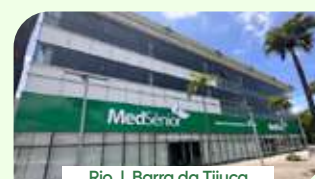
Rio | Barra da Tijuca