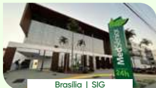
Brasília | SIG