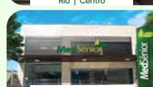
Niterói | Icaraí