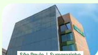
São Paulo | Sumarezinho