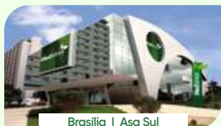
Brasília | Asa Sul