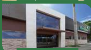
Vila Velha | Centro