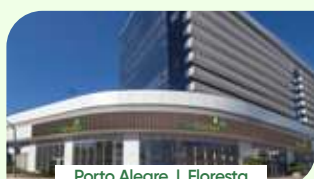
Porto Alegre | Floresta