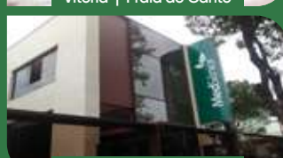
Vitória | Praia do Canto