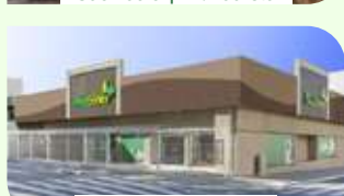
São Paulo | Tatuapé