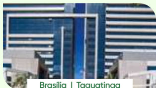
Brasília | Taguatinga