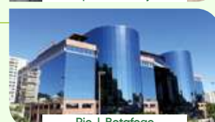
Rio | Botafogo