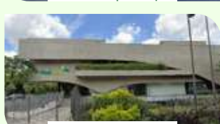
São Paulo | Av. Brasil