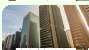
São Paulo | Av. Paulista