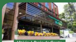
Vitória | Praia do Canto