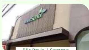
São Paulo | Santana