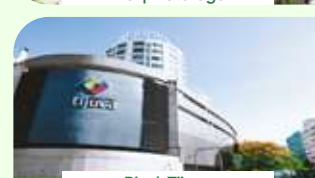
Rio | Tijuca