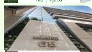
Rio | Centro