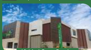
Vitória | Bento Ferreira