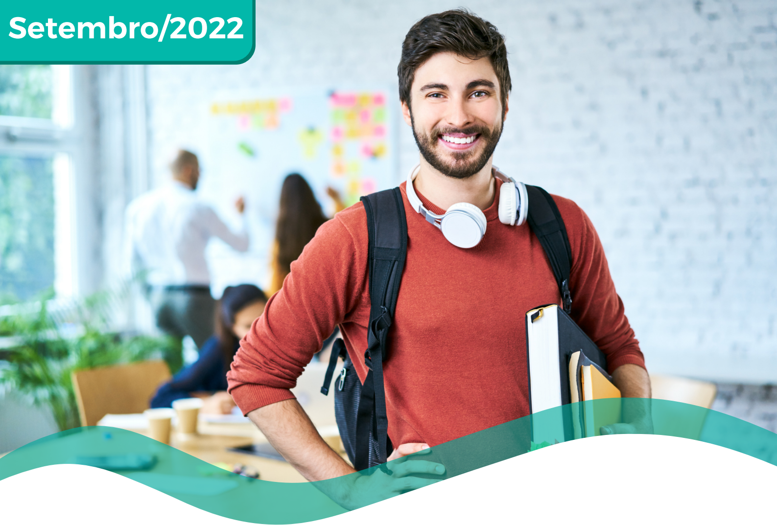
TABELA DE PREÇOS COLETIVO POR ADESÃO