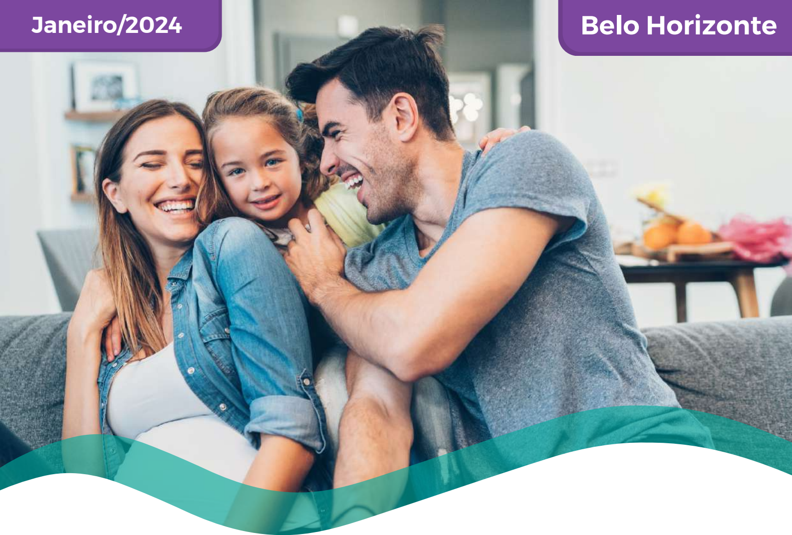
TABELA DE PREÇOS COLETIVO POR ADESÃO