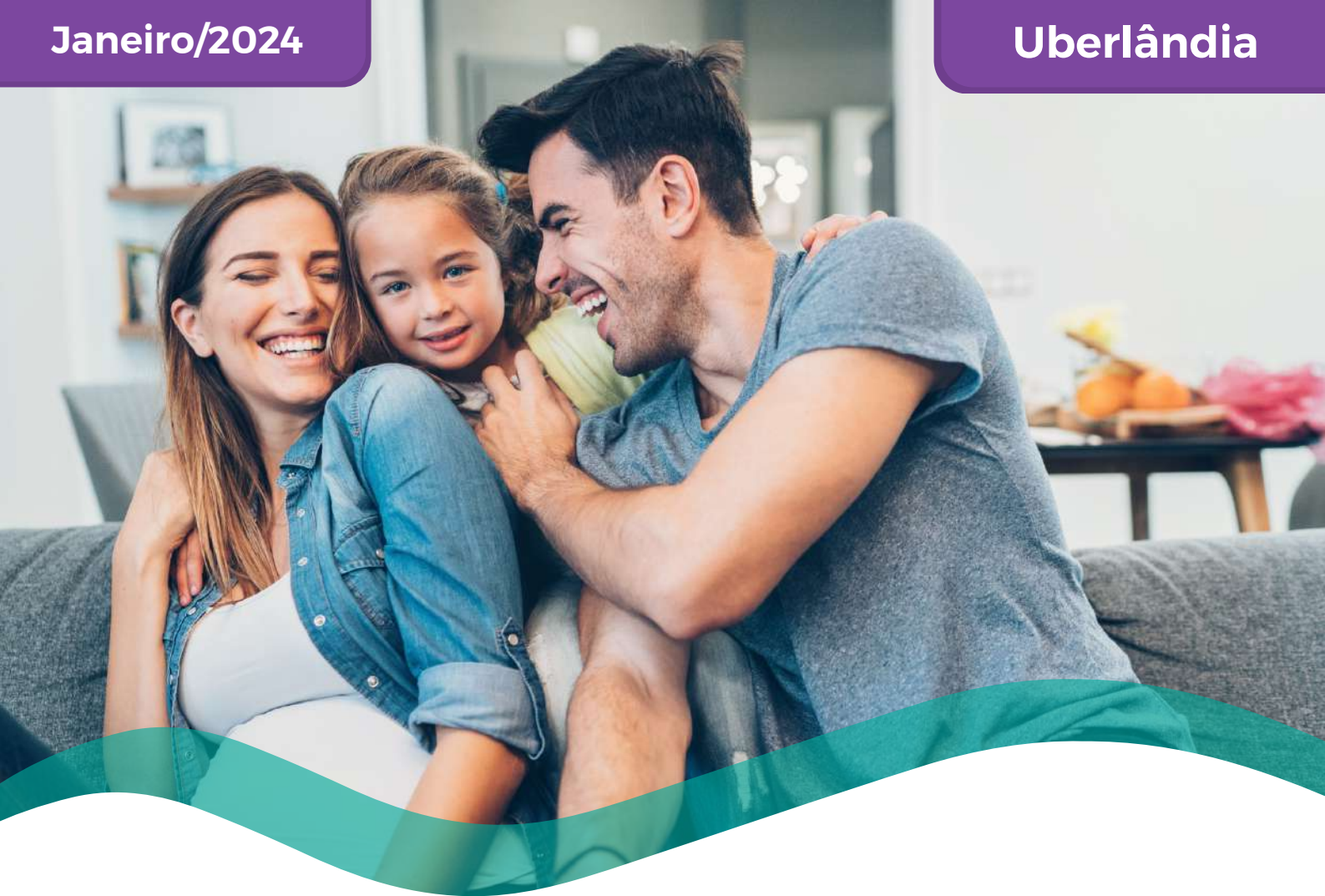
TABELA DE PREÇOS COLETIVO POR ADESÃO