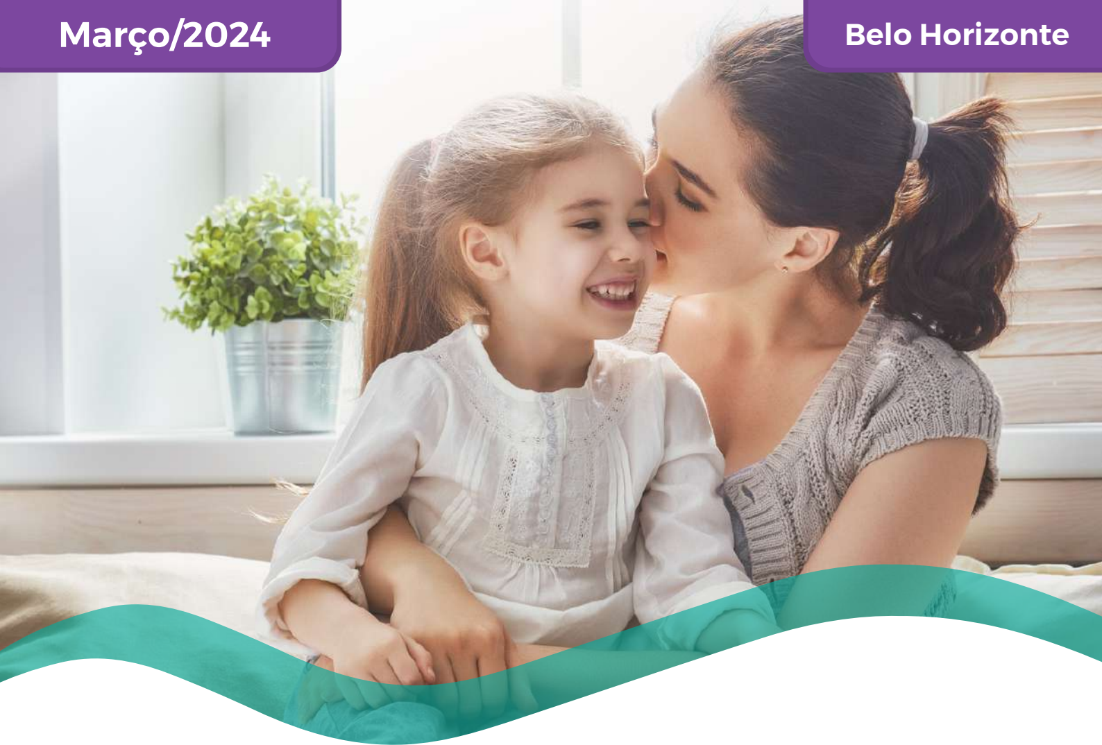
TABELA DE PREÇOS COLETIVO POR ADESÃO