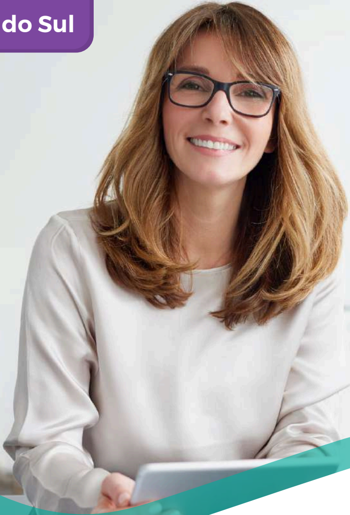
TABELA DE PREÇOS COLETIVO POR ADESÃO