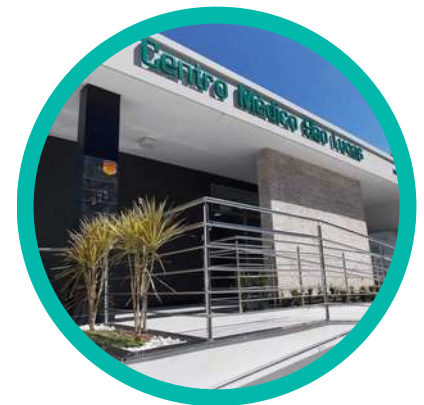
Centro Médico São Lucas