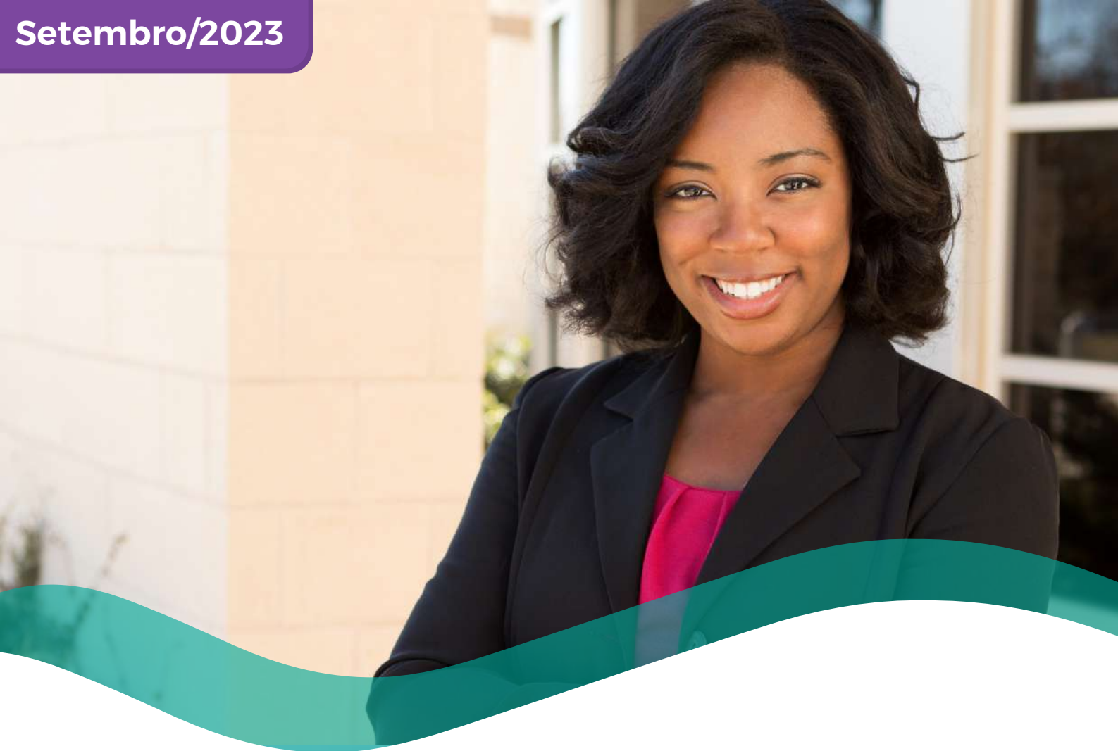
TABELA DE PREÇOS COLETIVO POR ADESÃO