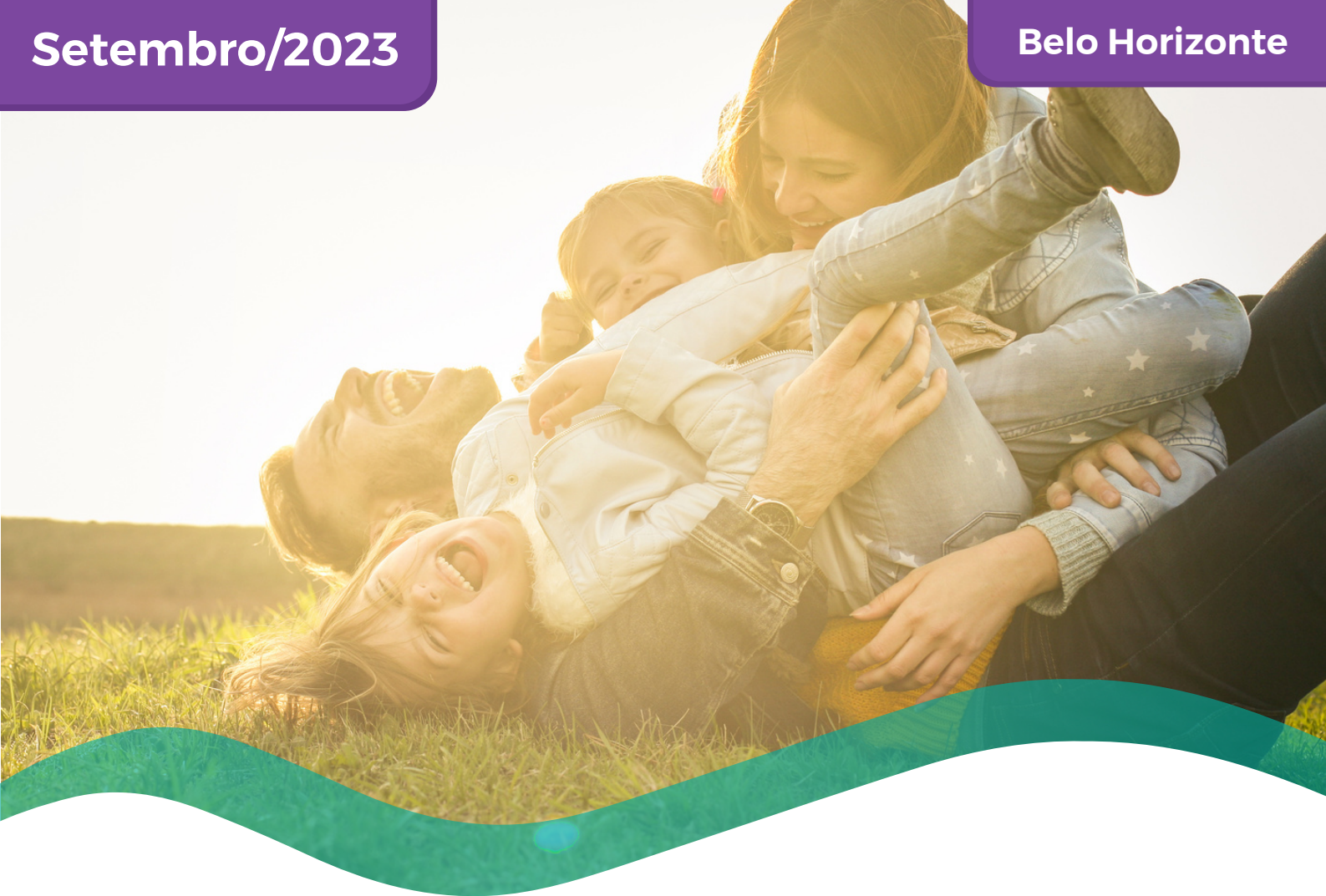
TABELA DE PREÇOS COLETIVO POR ADESÃO