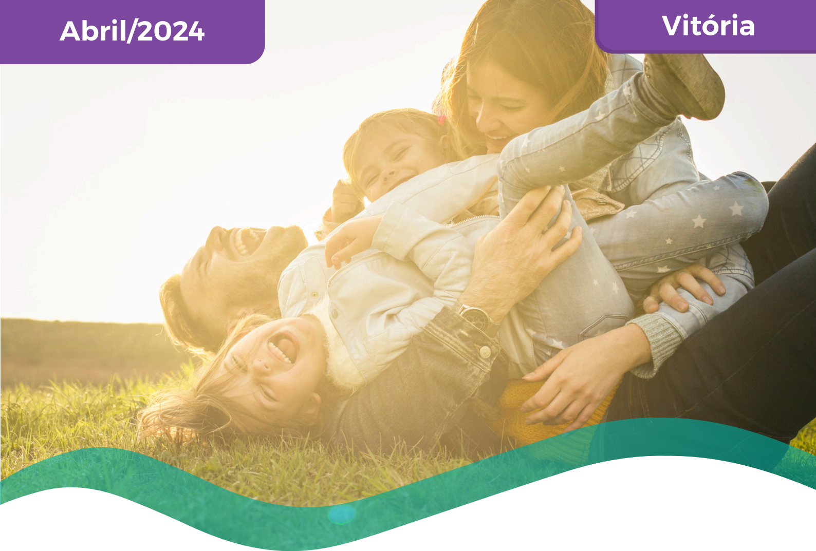
TABELA DE PREÇOS COLETIVO POR ADESÃO