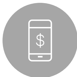
Tabela de preços